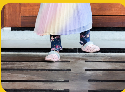
พื้นปูนขัดมัน มีเด็กหรือผู้สูงอายุใช้งาน