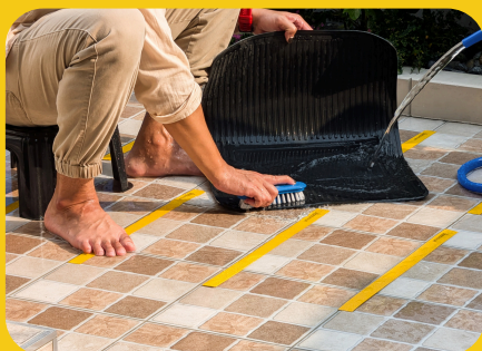
พื้นที่ซักล้าง มีโอกาสลื่นจากน้ำ, น้ำยาต่าง ๆ