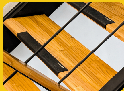
บันได พื้นต่างระดับ ซึ่งมีโอกาสลื่นสูง