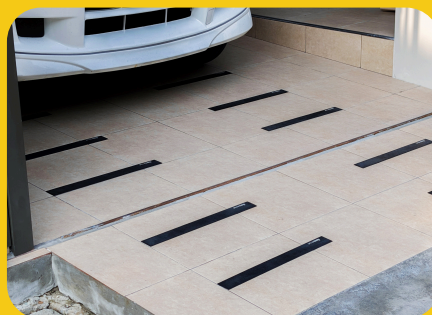
โรงรถ ทางลาดขึ้นโรงรถ