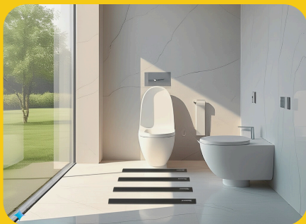
พื้นที่เปียกอยู่เสมอ เช่น ห้องน้ำ